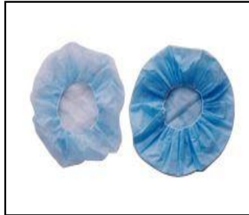
Cabeza + pelo