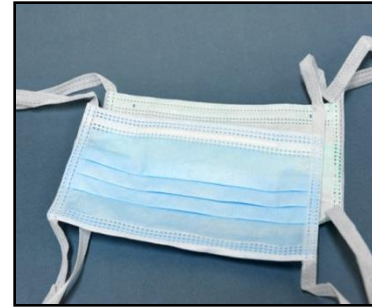
Nariz + boca