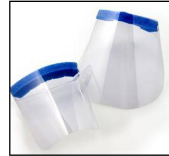
Ojos + nariz + boca