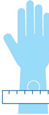
Pagsusuri ng TB sa Balat

Maaaring irekomenda ng iyong tagapagbigay ng pangangalagang pangkalusugan ang pagsusuri ng TB sa dugo dahil maaari itong gawin sa iisang pagbisita, at mas tumpak ito kung dati ka nang nabakunahan para sa TB. Sinusukat ng pagsusuri sa dugo kung paano tumutugon ang iyong immune system sa mga mikrobyo na nagdudulot ng TB.