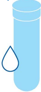
Pagsusuri ng TB sa Dugo

Mayroong dalawang uri ng pagsusuri para sa impeksyon sa TB. Makipag-usap sa iyong tagapagbigay ng pangangalagang pangkalusugan tungkol sa kung aling pagsusuri ang pinakamainam para sa iyo.