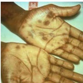
Gratèl segondè nan ka sifilis sou pla men yo.

Sentòm sifilis kay granmoun varye nan chak stad: