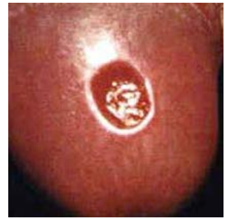
Egzanp yon blese sifilis primè.