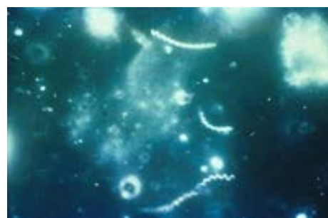
Mikwografi Treponema pallidum ki gen fon nwa.