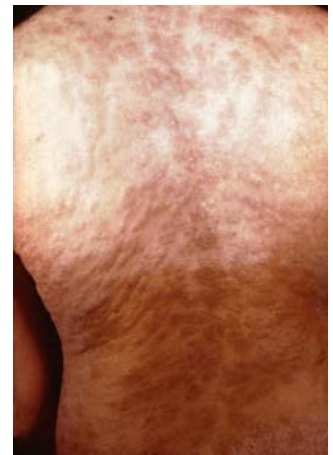
Gratèl segondè sifilis sou lestomak.

Pandan etap segondè a, ou ka gen gratèl sou po ou ak/oswa blesi nan bouch ou, nan vajen ou oswa nan anis (twou dèyè) ou (ki rele lezyon manbràn mizek tou). Anjeneral, stad sa a kòmanse avèk yon gratèl sou youn oswa plis zòn nan kò ou. Iritasyon an kapab parèt lè blese primè ou geri oswa anpil semèn apre blesi a geri. Iritasyon an kapab sanble tach gwosomodo, ki gen koulè wouj oswa mawon ak wouj nan plamen ou ak anba pye ou. Iritasyon po an pap demanje w an jeneral epi pafwa li tèlman lejè ou pa remake li. Kèk nan lòt sentòm ou ka genyen se kapab lafyè, gangliyon lenfatik anfle, malgòj, cheve ou k ap tonbe yon fason ki pa egal, maltèt, pwa kò ou bese, doulè miskilè, a epizman (ou santi ou fatige anpil). Sentòm yo ki nan stad sa a ap pase kit ou resevwa trètman kit