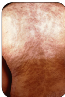
躯干梅毒二期皮疹