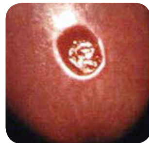
初期梅毒溃疡范例。

任何性活跃人士都有可能通过不安全的肛交、阴交或口交行为感染梅毒。与您的健康护理提供者进行公开坦诚的谈话，询问您是否应该接受梅毒或其他 STD 检测。若您已怀孕、属于男同性恋者、感染 HIV 和 / 或伴侣梅毒测试为阳性，则应定期接受梅毒测试。