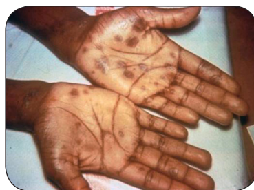
手掌梅毒二期皮疹。

大多数情况下，血液试验可用于检测梅毒。有些健康护理提供者将通过测试梅毒溃疡液体诊断梅毒。