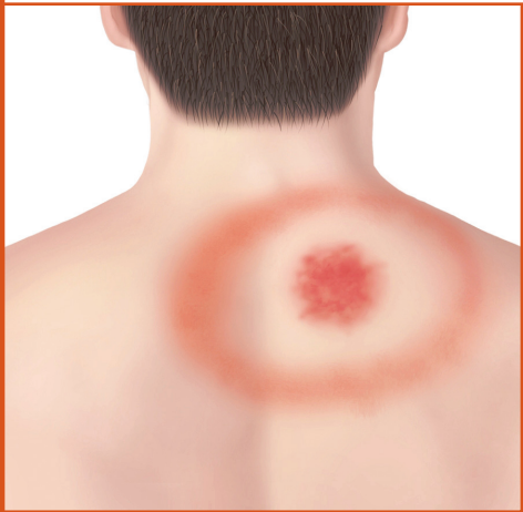
Erupción de "ojo de toro" en la espalda.