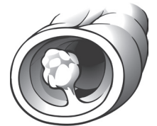
Pólipo en el colon