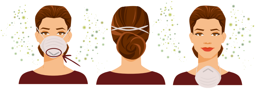
Không chính xác