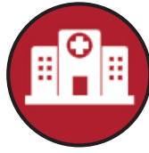
Hospitalización u operaciones quirúrgicas