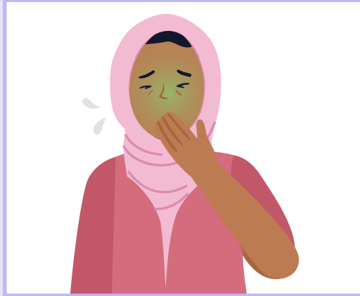
Nausea | دلبدی | زړه بدبڼه