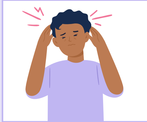
Headache | سردرد | د سر درد