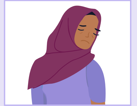
Tiredness | ماندگی | ستړیا