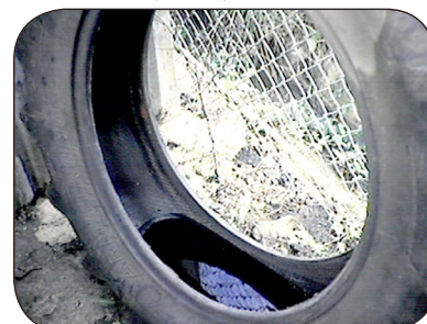
Recicle los neumáticos usados o manténgalos protegidos de la lluvia.