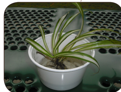
Ponga las plantas en tierra, no en agua.