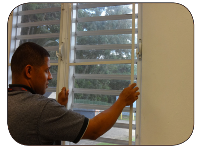
Instale o repare la malla o tela metálica de ventanas y puertas.