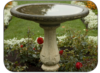
Vacíe el agua acumulada en fuentes y baños para pájaros semanalmente.