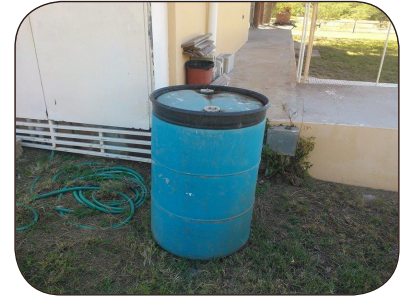
Mantenga los barriles para el agua de lluvia bien tapados.