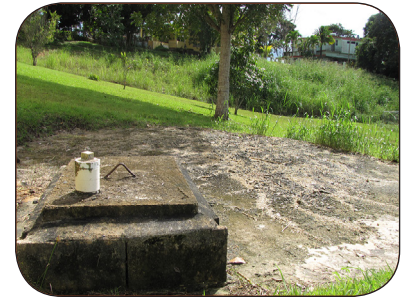
Mantenga el pozo séptico sellado.