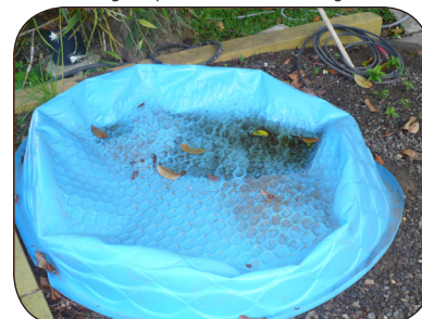
Vacíe las piscinas que no estén en uso.