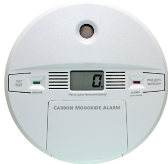
Detektè Monoksid Kabòn