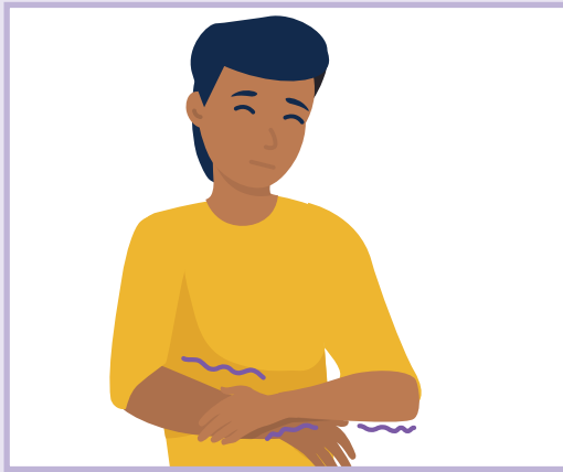
Arm weakness | د مت کمزورتيا | ضعيفی بازوها