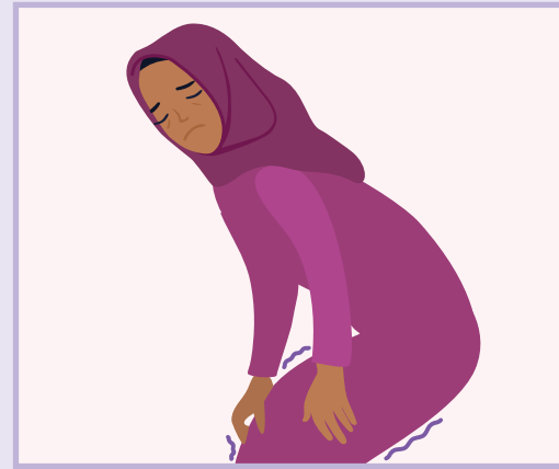
Leg weakness | د لينگی کمزورتيا | ضعيفی پایها