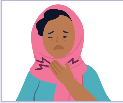
Sore throat | گلو درد | ږوخ ښووتس د

پوليو به آسانی انتشار پیدا می کند پوليو په آسانی سره خپریږي