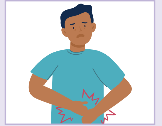
Stomach pain | دل درد | د معدي درد