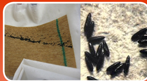
Los huevos tienen el aspecto de algo sucio negruzco.