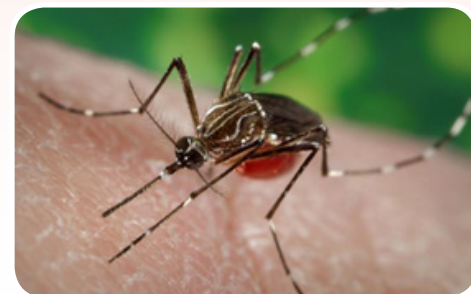
Un mosquito adulto pica a una persona.