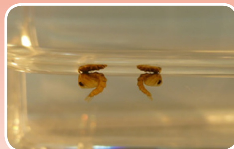
Crisálidas en el agua.