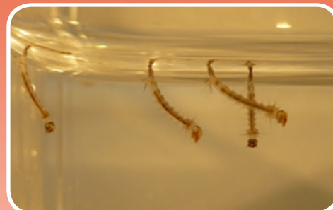
Larvas en el agua.