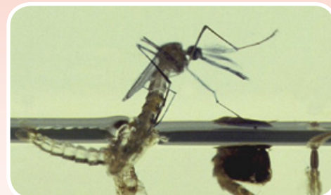
Un mosquito adulto sale de una crisálida.