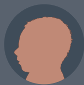
Tamaño normal de la cabeza

Usted puede transmitir el virus del Zika durante el embarazo.