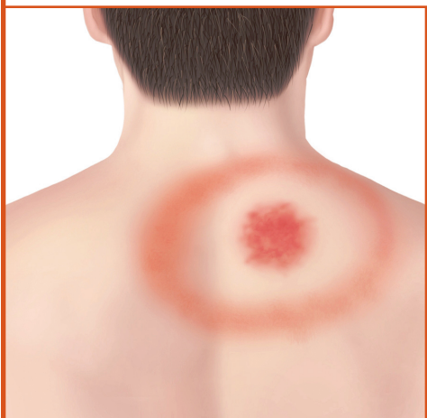
Erupção cutânea tipo "olho-de-boi" nas costas.