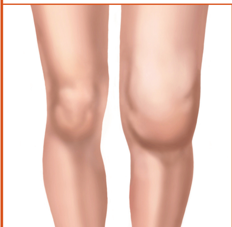
Joelho com artrite.