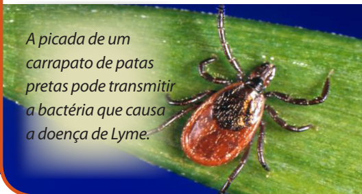
A picada de um carrapato de patas pretas pode transmitir a bactéria que causa a doença de Lyme.