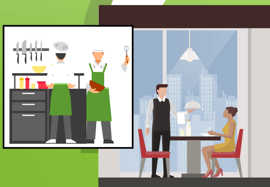
Trabajadores y clientes en el servicio de los alimentos