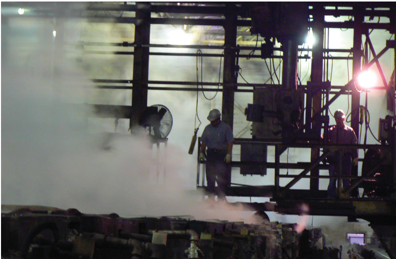
Empleados potencialmente expuestos a niebla ácida y al ruido durante la cosecha de producto en una planta de procesamiento de dióxido de manganeso.

Durante la reunión de clausura, los investigadores de NIOSH describen los hallazgos preliminares. Algunas veces, NIOSH proporciona informes preliminares por escrito mientras la investigación está en proceso. Después de analizar toda la información y los datos, NIOSH publica un informe final, por medio del cual comunica sus hallazgos y recomendaciones. Se envían copias de este informe al solicitante, al empleador, a los representantes de los empleados, a OSHA y a otras agencias correspondientes. El empleador debe fijar el informe final en un lugar accesible a los trabajadores de todas las áreas evaluadas. El empleador puede escoger en vez darle a NIOSH el nombre y dirección de los empleados afectados, permitiéndole a NIOSH de enviarles a cada uno una copia por correo.