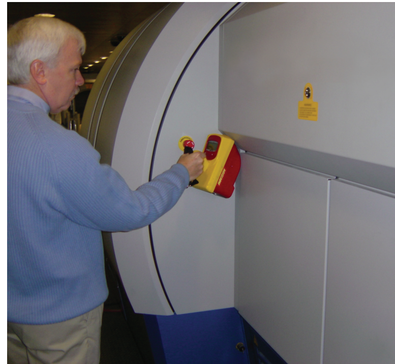
Investigador de HHE midiendo la radiación en un sistema de inspección de equipaje en un aeropuerto.

NIOSH desempeña las siguientes actividades: