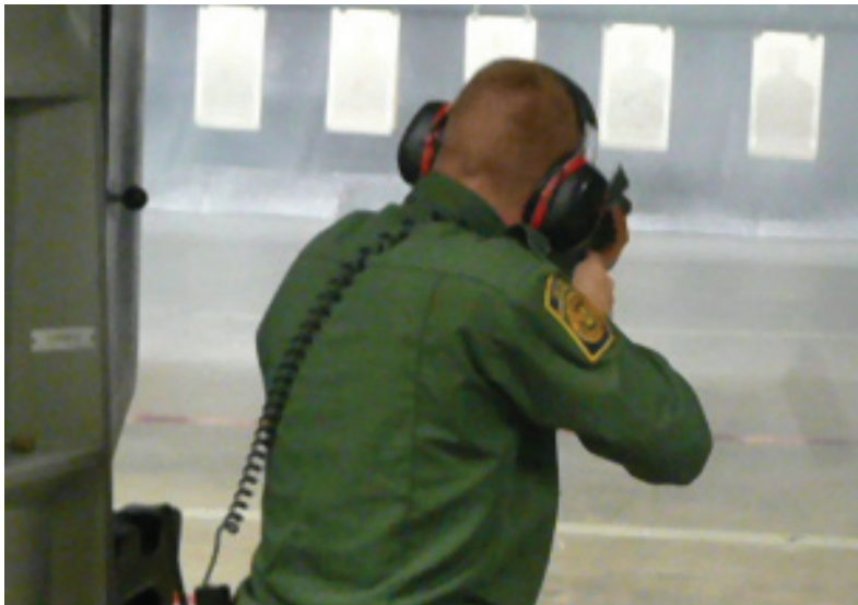
Agente del orden público disparando al blanco en un campo de tiro cubierto donde los investigadores de HHE hacían una evaluación por exposición al plomo.

Una evaluación de riesgos para la salud (HHE, por sus siglas en inglés) es una evaluación de los posibles riesgos para la salud en el sitio de trabajo. Empleados, representantes laborales o empleadores pueden solicitar un HHE si tienen una inquietud sobre riesgos para la salud en el trabajo. En una evaluación, los investigadores de NIOSH evalúan si existe un riesgo a la salud para los empleados debido a la exposición a condiciones o materiales peligrosos. Entre los elementos en el lugar de trabajo que estudia NIOSH se incluyen sustancias químicas como el plomo, el bromopropano y las cloraminas; agentes biológicos como el carbunco y el moho, agentes físicos como por ejemplo el estrés por calor, el ruido, la radiación y el estrés ergonómico.