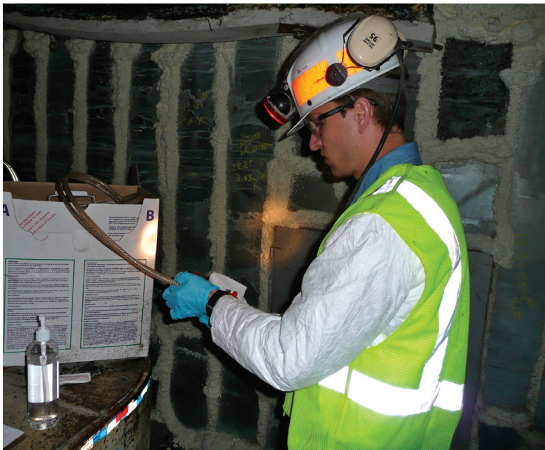
Investigador de HHE tomando muestras de isocianatos en una mina de carbón subterránea.