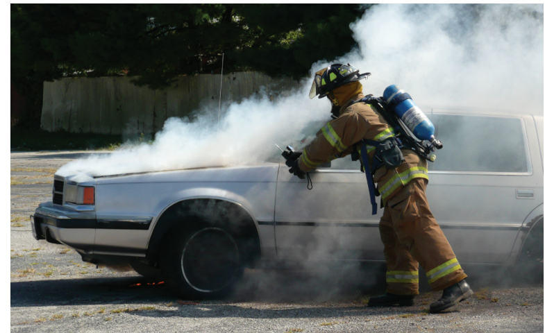
Un bombero ayudando a un investigador de HHE en la evaluación de la exposición a compuestos orgánicos volátiles durante la extinción de un de un auto en llamas.

Cuando NIOSH evalúa tipos de riesgos más comunes, no siempre es necesaria la visita al sitio de trabajo. Si no se realiza una investigación de campo, el programa de HHE, por lo general, debate las preocupaciones con el solicitante y proporciona una respuesta por escrito que incluye una evaluación de la situación y, de ser necesario, directrices sobre cómo reducir o eliminar los riesgos.