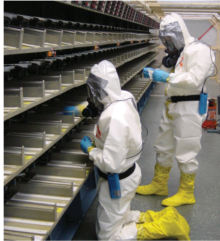
Investigadores de HHE evaluando la posible exposición al carbunco en una máquina de clasificación de correo.

El informe final es información pública y se hará disponible para una amplia audiencia con el fin de que otras personas se beneficien de los hallazgos y las recomendaciones. El informe final se publicará en los sitios web de NIOSH y de los CDC.