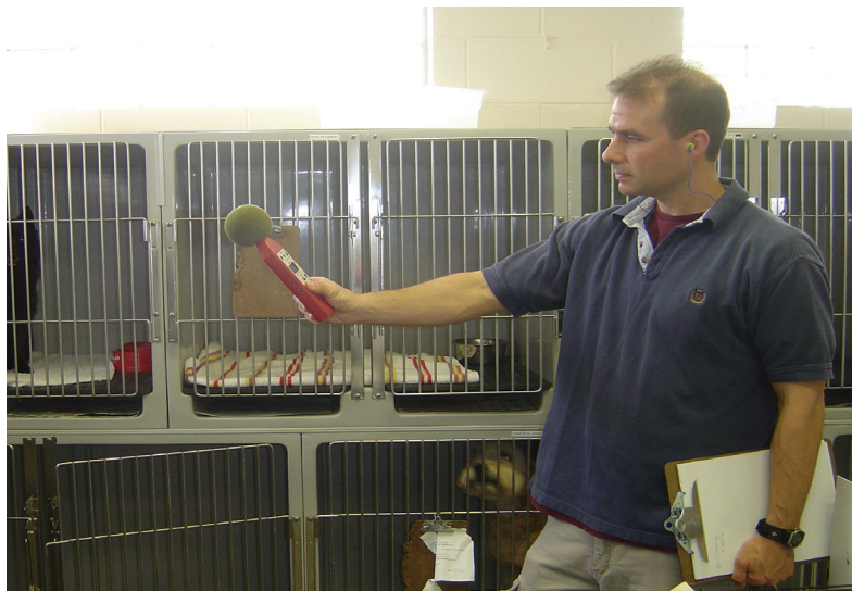
Investigador de HHE midiendo el nivel de ruido en un refugio de animales.

El Instituto Nacional para la Seguridad y Salud Ocupacional (NIOSH) forma parte de los Centros para el Control y la Prevención de Enfermedades (CDC), una agencia del Departamento de Salud y Servicios Humanos. NIOSH ofrece liderazgo a nivel nacional e internacional en la prevención de enfermedades, lesiones, discapacidades y muertes relacionadas con el trabajo, mediante la recolección de datos, la realización de investigaciones científicas y la transferencia del conocimiento obtenido en la creación de productos y servicios.