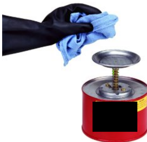
Fotografía 1. Una solución mejor para dispensar el solvente