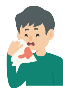
Tos con sangre o esputo (flema que sale del fondo de los pulmones)