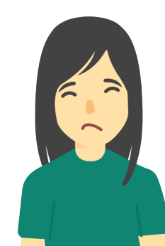
Debilidad o fatiga