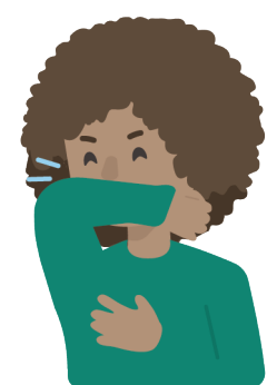
Tos que dura más de 3 semanas

Los síntomas de la enfermedad de tuberculosis activa son: