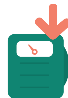
Pérdida de peso