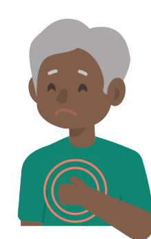
Dolor de pecho