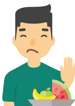
Falta de apetito